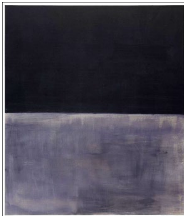
Mark Rothko, Sans Titre (Gris sur Noir) , 1970

langage symbolique. Si les noms de ces penseurs sont parfois moins connus du grand public (Jacques Derrida ou Jean Baudrillard hier, Peter Sloterdijk ou Slavoj Žižek aujourd'hui, par exemple), leur influence n'en est pas moins immense sur notre société. Pour prendre un exemple trivial, l'œuvre de Baudrillard (1929-2007) est ainsi l'une des principales influences du film de science-fiction à succès «Matrix» (Lana & Lilly Wachowski, 1999)! Pousser l'esprit critique jusqu'aux extrémités du scepticisme et de l'ironie, comme le fait le post-modernisme, permet certes de prendre une saine distance par rapport aux grandes idées trop simplistes. Mais cela peut aussi conduire à une forme d'abdication morale, nous transformant en simples observateurs cyniques et détachés du monde qui nous entoure.