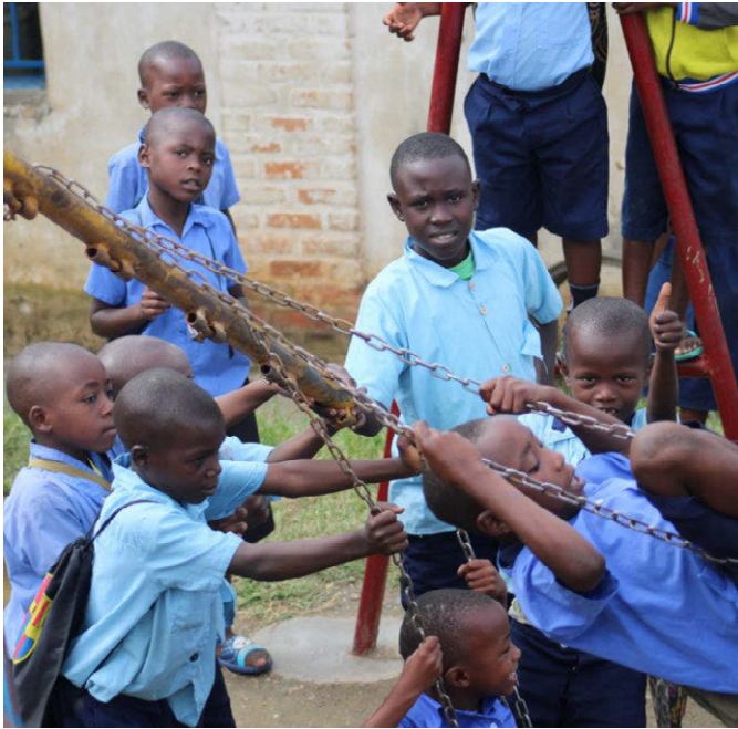
Fiche du projet DM 164.7041